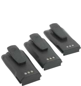
Li Ion, NiCd ve NiMH bataryalar