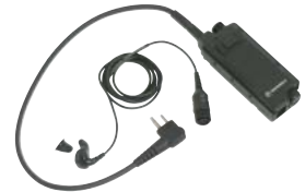
BDN6646 – "Voiceducer" (PTT ve Standart Kulaklık)