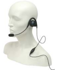
RMN5015 – Dayanıklı, Yarış Tipi Başlık seti (RKN4090 Başlık seti adaptör kablosu ile çalışır)