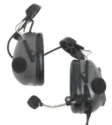
RMN4053 – Pasif kulak koruyucu, başlığa takılabilir kulaklık seti. (Gri) (RKN4094 Kablo üzeri PTT adaptörü ile çalışır)