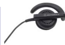
BDN6720 – Esnek Kulak Alıcısı

Tuş takımı kullanıcının sık aranan kişi veya gruplar için çağrılarını hızla başlatabilecek şekilde düzenlenmiştir. Tuş takımı kilitleme fonksiyonu telsizin yanlışlıkla çağrı yapmasını engeller.